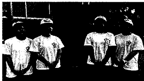
硬式野球部マネージャー