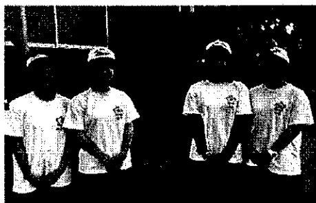
硬式野球部マネージャー